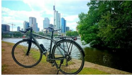
Radfahren am Riedberg