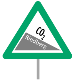
KIR CO 2 Barometer

Viele Aktionen und Veranstaltungen im vierten Vereinsjahr der KIR